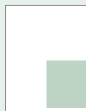
1/4 PAG. 92 x 125