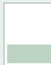
1 PIE 190 x 73